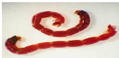
личинки комаров – звонцов